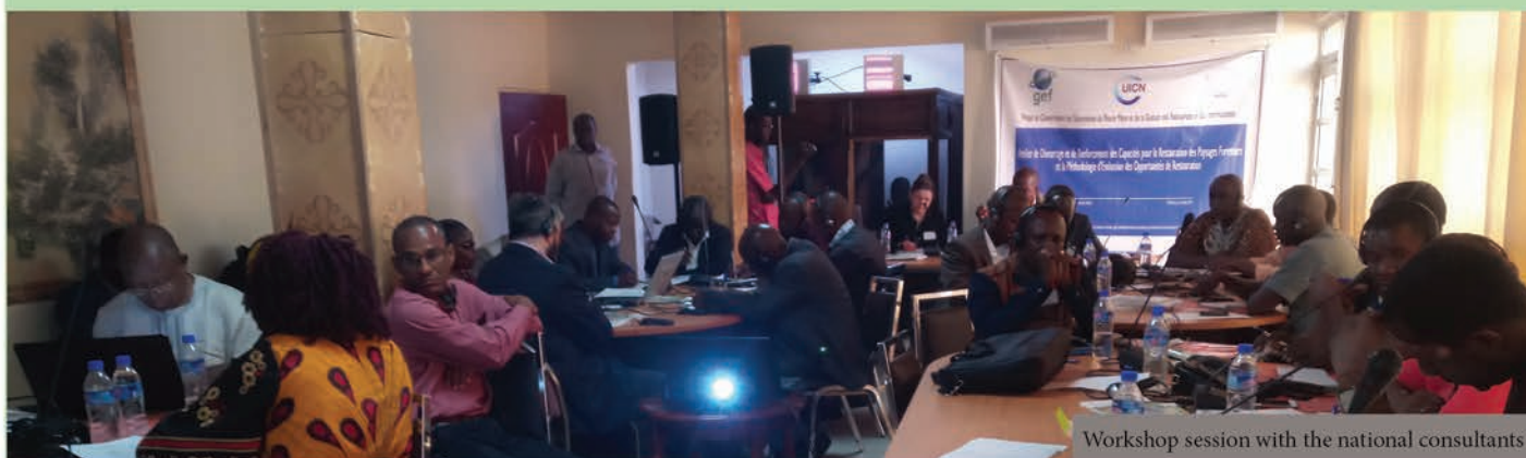
Workshop session with the national consultants

Depuis l'atelier de renforcement des capacités sur la Méthodologie d'Evaluation des Opportunités de Restauration (MEOR) et la Restauration des Paysages Forestiers (RPF) dans l'Union du fleuve Mano, du 25 février au 1er mars 2019 à Monrovia, Liberia, les consultants nationaux avec l'appui des experts internationaux ont entamé la réalisation des cartes de dégradation et de restauration, ainsi que la carte des objectifs. Il leur reste à quantifier les zones concernées et à compléter la carte des opportunités. Cette phase devrait prendre fin le 15 Septembre 2019 au plus tard, afin de permettre aux experts internationaux de produire les différentes cartes transfrontalières pour ajuster la stratégie de restaurations des paysages forestiers dans l'Union du fleuve Mano.